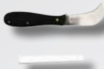
Gummimesser und Kreide