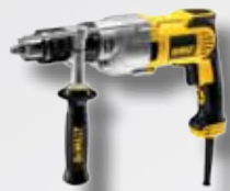
Bohrmaschine und 10mm Steinbohrer